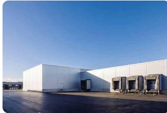
AI - genererad. Möjlig utformning av lokalen.